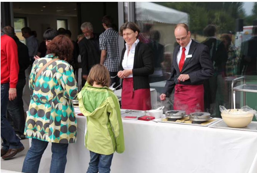
... sowie die „Waffelprofis“ des langjährigen Kunden Westphalenhof sorgten für das leibliche Wohl.