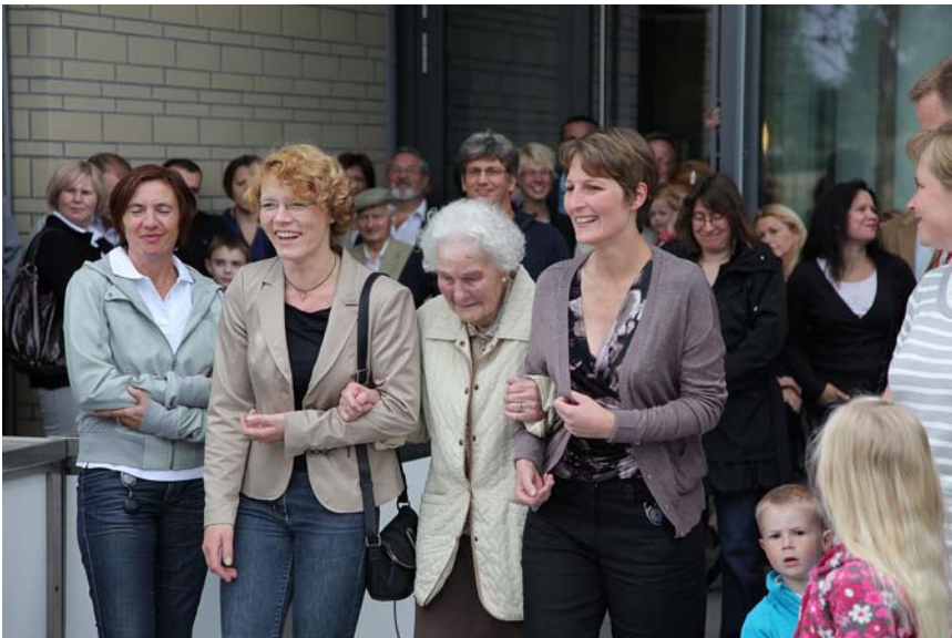
Die eher „durchwachse- ne“ Witterung konnte der guten Laune nichts anhaben.