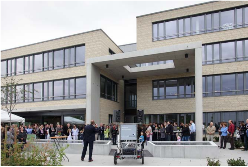
Party-Location: Der 2010 bezogene neue Connexxt Campus